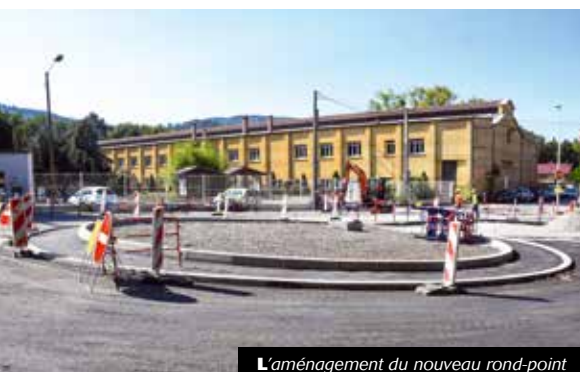
L'aménagement du nouveau rond-point

L'aménagement du carrefour Schuman-Frachon entre dans une nouvelle phase. La totalité des réseaux (assainissement et électriques) ont été repris. Les travaux suivent leur cours sans retard, la seconde phase concernant la voirie, notamment l'aménagement d'un rond-point, a débuté depuis