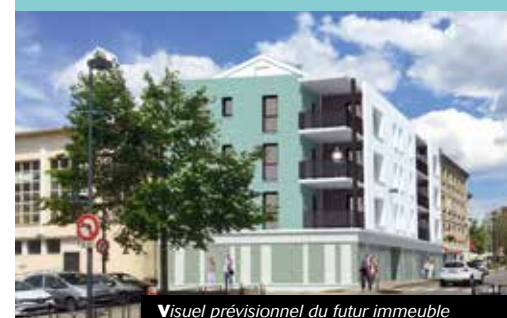
Visuel prévisionnel du futur immeuble

La démolition des bâtiments du 2 et 4 rue de la République est imminente. Ils laisseront place à un nouvel immeuble aux proportions similaires. Une déviation sera mise en place pendant les travaux pour les riverains et l'accès à la crèche Les Pirouettes.