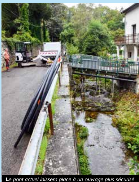
Le pont actuel laissera place à un ouvrage plus sécurisé

Après diagnostic, il a été établi que le pont des Fourches, situé à l'entrée de la vallée de Cotatay, présentait un caractère de vétusté. Des travaux de destruction, puis de remplacement de l'édifice ont donc débuté fin septembre. Ils devraient durer jusqu'en fin d'année 2020. Un nouveau pont, plus large et sécurisé sera installé en lieu et place.