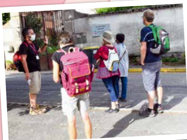
Visite guidée de la vallée de Cotatay organisée par l'Office de tourisme de Saint-Etienne Métropole pour un retour sur le passé historique et industriel de la vallée.