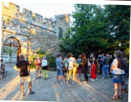
Belle réussite et plus de 100 personnes pour la visite guidée des extérieurs du château Feugerolles, suivi d'un concert en plein air.