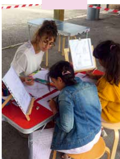
L'un des nombreux rendez-vous de l'été avec son lot d'animations, de jeux et d'ateliers.