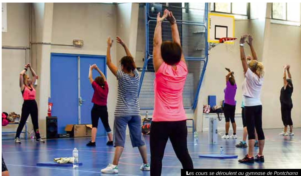
Les cours se déroulent au gymnase de Pontcharra