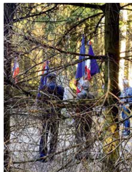
Commémoration de la libération et des combats de La Versanne.