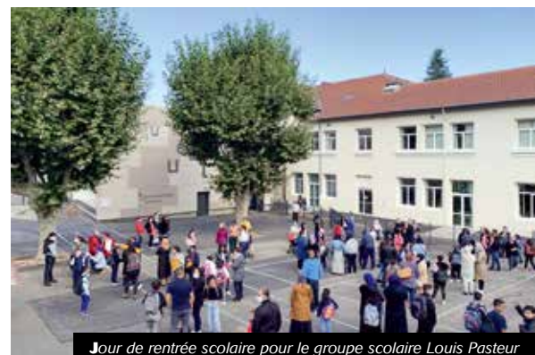
Jour de rentrée scolaire pour le groupe scolaire Louis Pasteur

Les enseignants, la ville et les agents des établissements scolaires restent mobilisés pour permettre aux 1 500 élèves d'apprendre et s'instruire de la plus belle et sûre des manières.