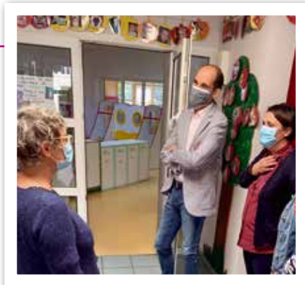
Visite de rentrée dans les structures de la petite enfance.