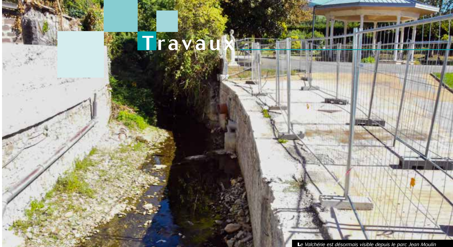
Le Valchérie est désormais visible depuis le parc Jean Moulin