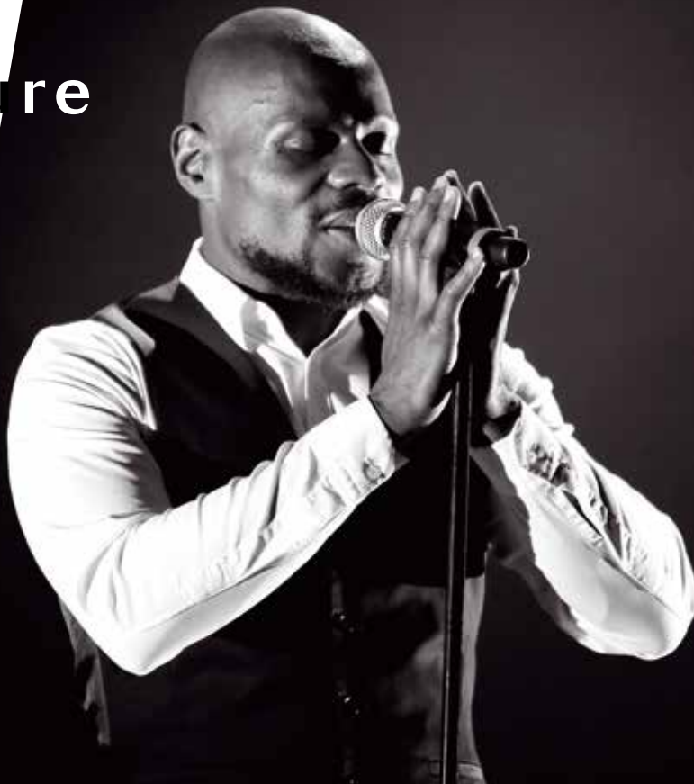
Les stéphanois du groupe Terrenoire joueront en première partie de Kery James le 20 novembre.