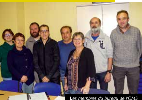
Les membres du bureau de l'OMS

Renseignements : catherine.jousserand@gmail.com