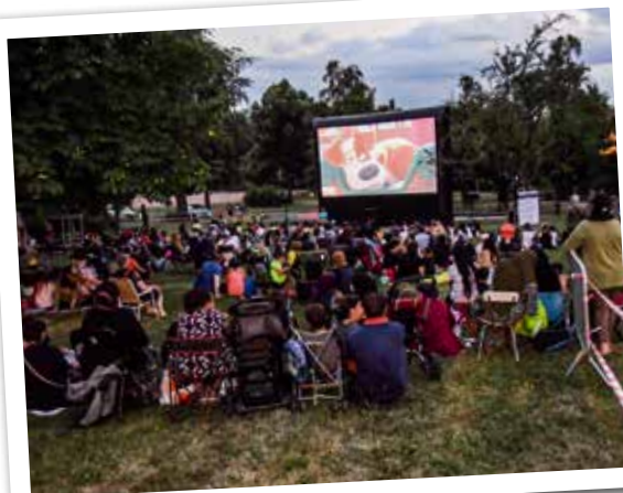
Séance de cinéma en plein air dans le parc Jean-Jacques Rousseau.