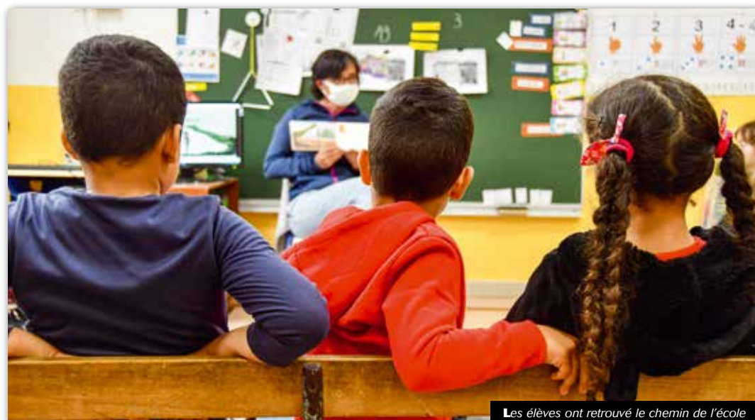
Les élèves ont retrouvé le chemin de l'école

Pas de doute possible, la seconde partie de l'année scolaire 2019/2020 restera à jamais gravée dans nos mémoires. Après un été pour reprendre ses esprits, la rentrée a pu se dérouler de la manière la plus habituelle possible... en apparence.