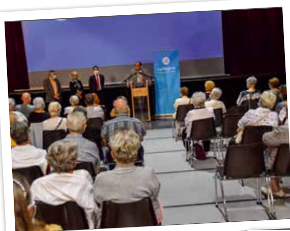
Présentation du pass région seniors à La Forge.