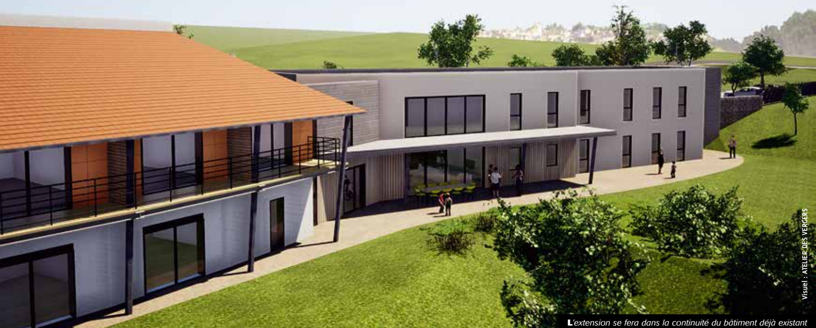
L'extension se fera dans la continuité du bâtiment déjà existant