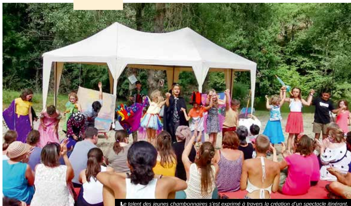
Le talent des jeunes chambonnaires s'est exprimé à travers la création d'un spectacle itinérant.