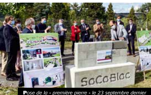
Pose de la « première pierre » le 23 septembre dernier

Afin de permettre la réalisation de ces 2 projets, l'actuel bâtiment de 850 m 2 doublera de surface, ce qui permettra d'accueillir 8 enfants et d'étendre la capacité à 16 adultes. Les travaux ont débuté fin septembre pour une mise en service prévue pour fin 2021.