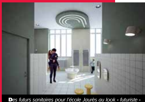
Des futurs sanitaires pour l'école Jaurès au look « futuriste »

Un intérêt tout particulier a également été porté sur les équipements de la petite enfance, comme la crèche les Pirouettes avec des travaux de menuiserie pour équiper le sas d'entrée d'un paravent en plexiglass dans le but de protéger au maximum la zone d'activité des tout-petits.