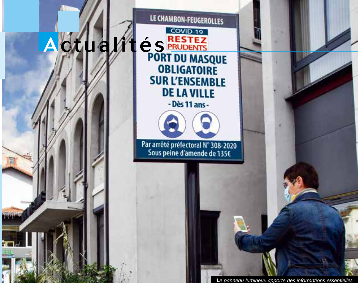
Le panneau lumineux apporte des informations essentielles