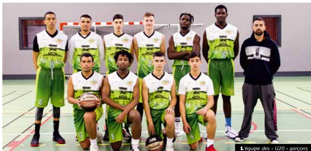
L'équipe des « U20 » garçons