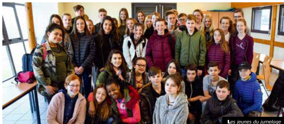
Les jeunes du jumelage

médiathèque municipale au 04 77 40 04 40