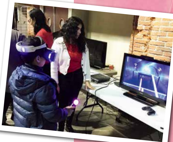
La soirée « Super écrans » a réuni un peu plus de 450 personnes à La Forge. Ateliers ludiques, robotiques et jeux vidéos étaient au programme