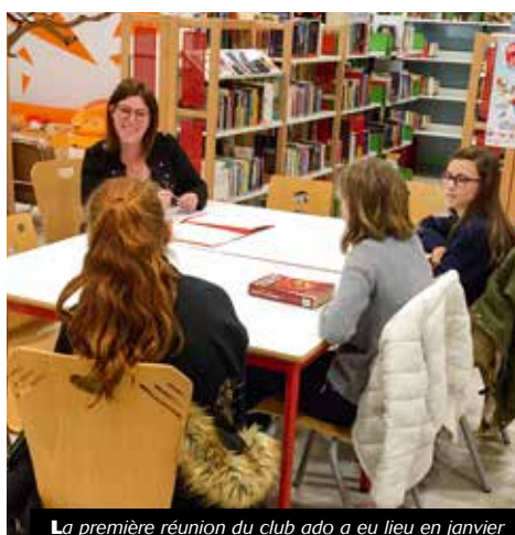
La première réunion du club ado a eu lieu en janvier

Offrir un espace d'échanges et de discussions, c'est l'idée du Club ado de la médiathèque municipale.