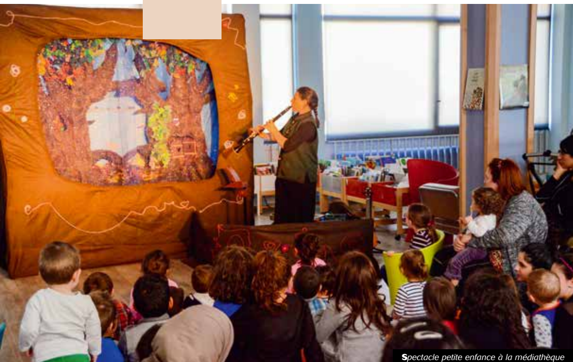
Spectacle petite enfance à la médiathèque