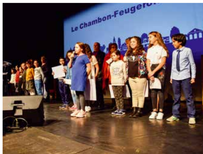
Les membres du Conseil Municipal Enfants et ceux du Conseil Communal des Aînés étaient présents lors de la soirée des vœux, à La Forge