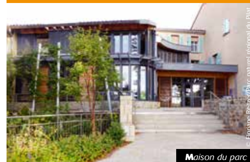
Maison du parc