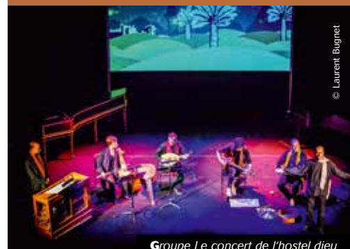
Groupe Le concert de l'hostel dieu

Second événement, vendredi 15 mai à 20h30 à l'Espace culturel Albert Camus , l'histoire de l'explorateur Marco Polo, mise en musique par le groupe « Le concert de l'hostel dieu ».