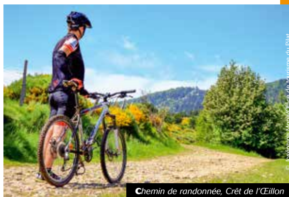
Chemin de randonnée, Crêt de l'Éillon

Le Pilat se pratique de mille et une façons : marcheurs, cyclistes, cavaliers, traileurs ou encore amateurs d'activités nordiques, que