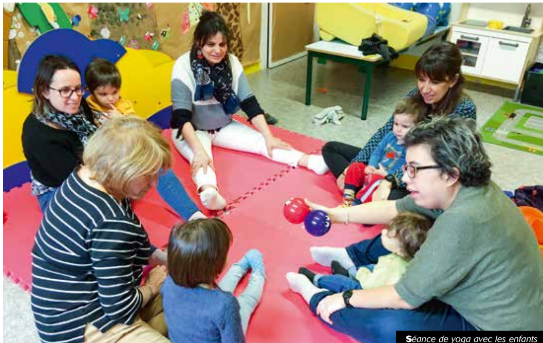
Séance de yoga avec les enfants