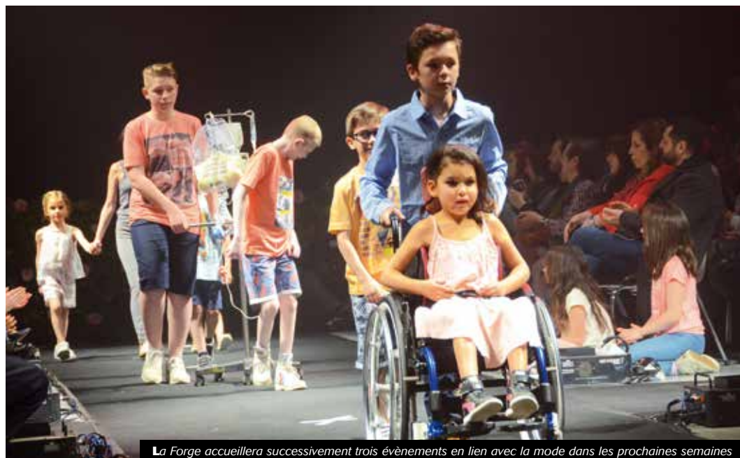
La Forge accueillera successivement trois évènements en lien avec la mode dans les prochaines semaines

Renseignements et réservations au : 04 77 02 15 82