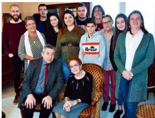
Visite chez les centenaires chambonnaires